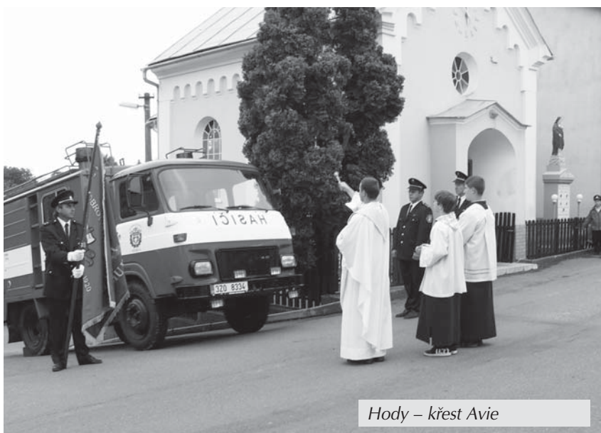
Hody – křest Avie