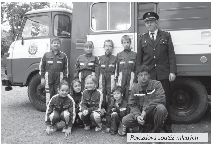
Pojezdová soutěž mladých

Náš okrsek jako jediný v okrese a snad i v celé republice pořádá pro hasičskou mládež zábavnou formou