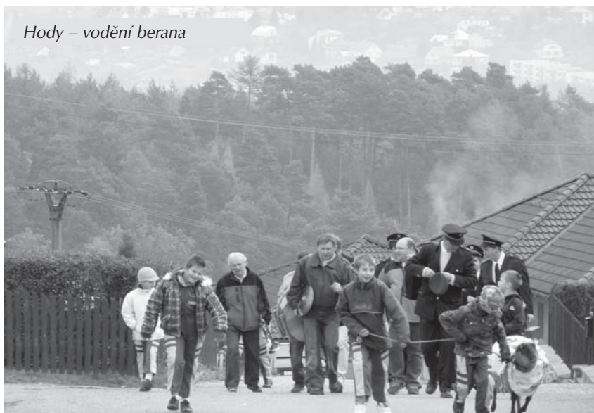
Hody – vodění berana