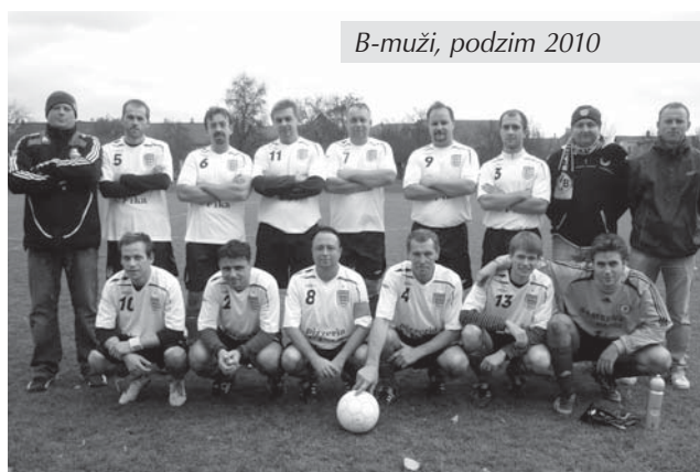
B-muži, podzim 2010