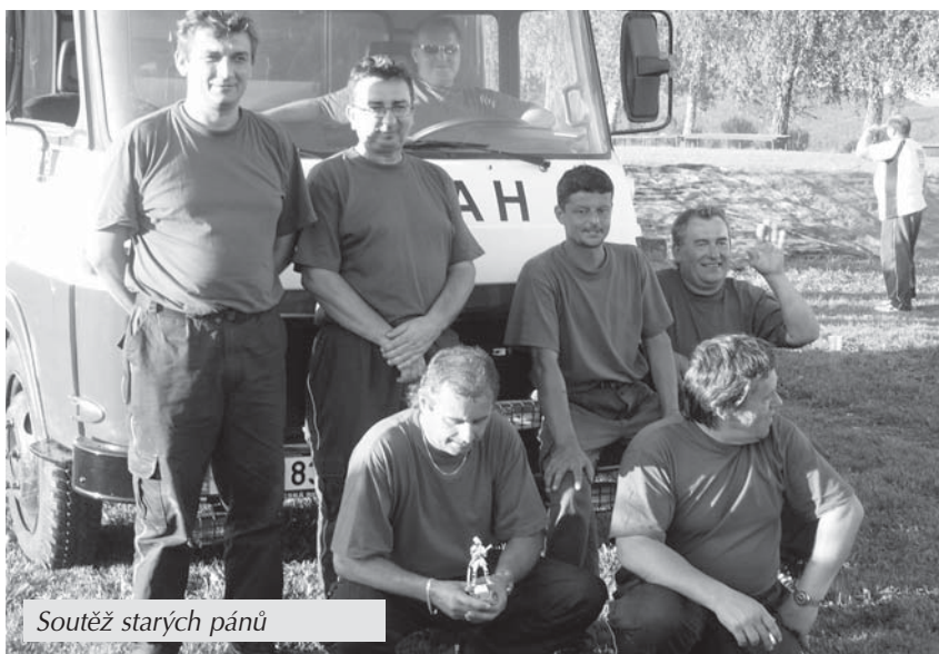
Soutěž starých pánů

Po schůzi proběhl přesun na odpolední slavnostní program zaměřený na výstavu fotek, pohárů ze soutěží, staré techniky ve zbrojnici a kulturního dění u pizzerie. Zde byl pro děti nachystán skákací hrad a pro dospělé posezení