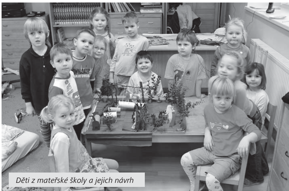
Děti z mateřské školy a jejich návrh