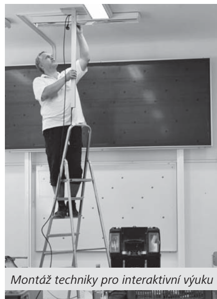
Montáž techniky pro interaktivní výuku

ním svých učitelek, návrhy nového vybavení školní zahrady vytvářeli také školáci ve školní družině, kteří zahradu využívají v odpoledních hodinách. Výsledkem byly zajímavé nápady, děti zde promítly své představy o uspořádání venkovních prostor. Návrhy jsme předali panu starostovi, který zařídil vše potřebné. Výsledkem našeho společného snažení je radostná zpráva: Ministerstvo pro místní rozvoj České republiky rozhodlo, že náš projekt získá v rámci programu Podpora obnovy a rozvoje venkova, dotační titul č. 2 - podpora zapojení dětí a mládeže do komunitního života v obci, dotaci 381 746 Kč (celková cena projektu činí 545 352 Kč). I když je obec povinná se finančně spolupodílet, uvedenou částku velmi vítáme. Věřím, že při posuzování projektu hrálo velkou roli i aktivní zapojení maminek z Unie rodičů