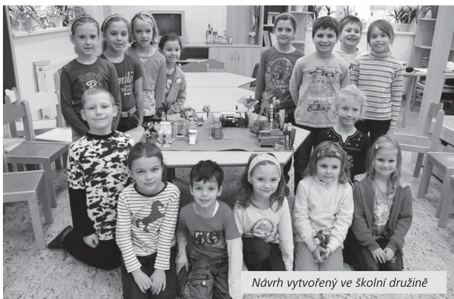
Návrh vytvořený ve školní družině

ním svých učitelek, návrhy nového vybavení školní zahrady vytvářeli také školáci ve školní družině, kteří zahradu využívají v odpoledních hodinách. Výsledkem byly zajímavé nápady, děti zde promítly své představy o uspořádání venkovních prostor. Návrhy jsme předali panu starostovi, který zařídil vše potřebné. Výsledkem našeho společného snažení je radostná zpráva: Ministerstvo pro místní rozvoj České republiky rozhodlo, že náš projekt získá v rámci programu Podpora obnovy a rozvoje venkova, dotační titul č. 2 - podpora zapojení dětí a mládeže do komunitního života v obci, dotaci 381 746 Kč (celková cena projektu činí 545 352 Kč). I když je obec povinná se finančně spolupodílet, uvedenou částku velmi vítáme. Věřím, že při posuzování projektu hrálo velkou roli i aktivní zapojení maminek z Unie rodičů