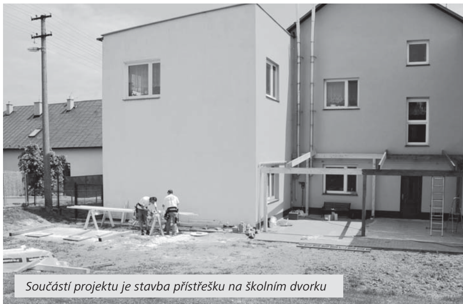
Součástí projektu je stavba přístřešku na školním dvorku

Všichni však víme, že nelze usnout na vavřínech a je třeba dále vylepšovat to, co již slouží svému účelu. Po roce nás opět oslovil pan starosta, tentokrát se žádostí o vytvoření návrhu na novou kompozici školní zahrady. Již vloni jsme byli úspěšní se žádostí o nové vybavení školní družiny (projekt Veselá škola). Do práce se tedy pustily děti z mateřské školy pod vede-