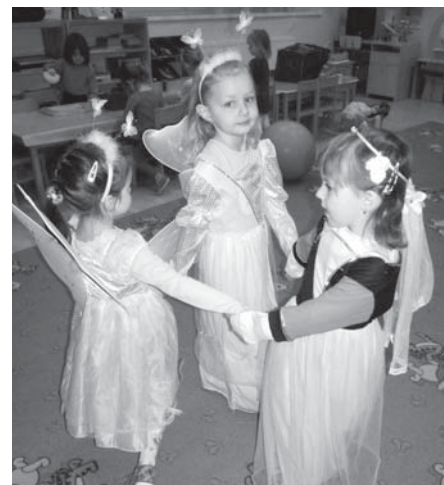
Za odměnu si po dobře vykonané práci holčičky zatančily vílí taneček

Na závěr projektového týdne jsme uspořádali výstavu dětských návrhů. U výstavu nakreslených obrázků a vytvořených modelů děti nadšeně vysvětlovaly rodičům své návrhy a „projektové záměry“. Rodiče přidali některé své nápady na vylepšení.