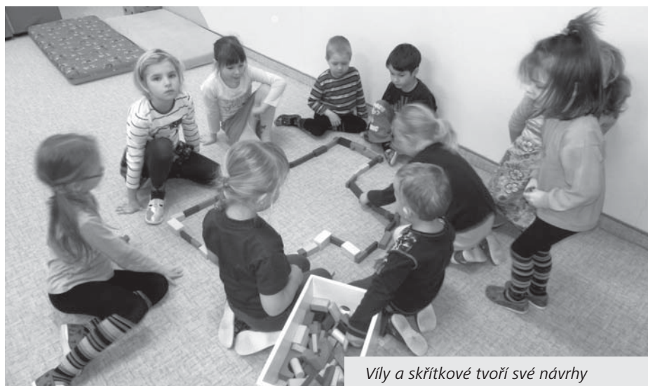
Víly a skřítkové tvoří své návrhy