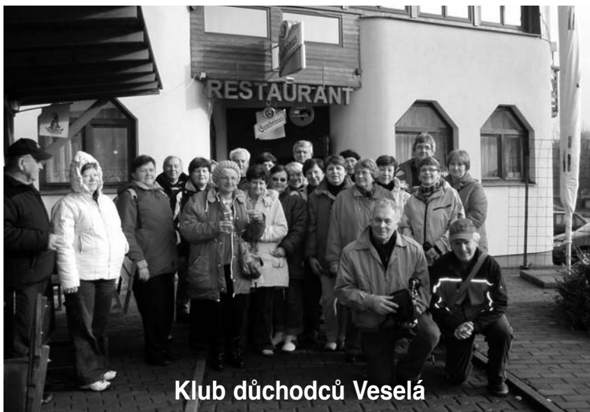
Klub důchodců Veselá

V úředních hodinách si můžete na obecním úřadě ověřit podpisy a pravost listin a dokumentů. Tato služba se provádí za úplaty – ověření 1 podpisu nebo 1 strany dokumentu stojí 30 Kč.