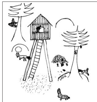
Na posedu (Vladimír Dlabaja, 3. roč.)

Beseda byla pro děti velmi příznivá a poutavá, pan Chaloupek své vyprávění okořenil vlastními příhodami. Svým vystoupením seznámil děti s významem činnosti myslivců – hospodářů našich lesů. Za pečlivě připravenou přednášku děkujeme.